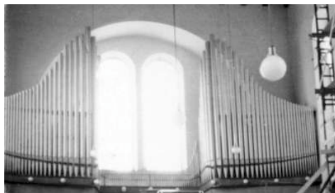
Varhany v Židenicích

Důležitou součástí slavení liturgie je i duchovní hudba. Její historie i tradice nabízí několik forem. Jednou z nich je i společný zpěv písní celým shromážděním. Jaksi samozřejmě přijímáme u společného zpěvu varhanní hru. Vnímáme predehry, mezihry i doprovod zpěvu. Mnozí z vás dokonce poznají konkrétního varhaníka podle stylu hry. Abychom mohli varhany slyšet a podle