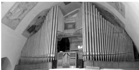
Varhany v Chorvatském Grobu

nich zpívat, musí probíhat mnoho činností. Jsou to především jejich pravidelná údržba a průběžné ladění. V některém z dílů připravovaného varhanního seriálu se pokusíme nahlédnout do zákulisí královského nástroje. Co je však u varhan neopakovatelné, je jejich návrh a vlastní stavba. Většinou se životní příběh varhanního nástroje pojí s příslušným kostelem, některé chrámy zažily během své existence stavbu i více nástrojů. I náš farní kostel si ve své – již skoro osmdesátileté – historii může u dnešních varhan napsat pořadové číslo 3.