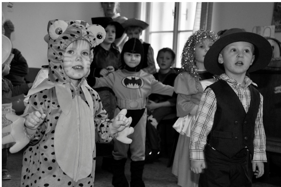
Dětský karneval na oratoři kostela

a pomodlili se s jáhnem Karlem. Bylo nám spolu dobře, dětem se karneval líbil, a tak se již těšíme na další.