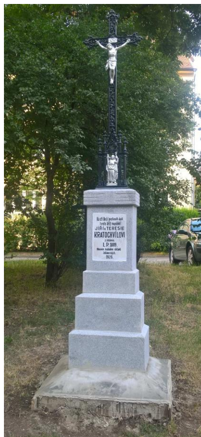
Současné umístění kříže

Jeho odstranění bylo „nutné“, protože před školou se mělo vybudovat nástupní a výstupní pódium zastávky městské autobusové dopravy, že by cestujícím kříž překážel a k zastávce se nehodil. Pódium doposud nestojí, zato kříž odpočívá v zeleni za našim kostelem; z farníků, kteří jej přestěhovali, již asi nikdo nežije.