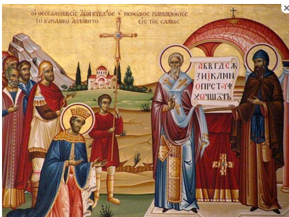
Uvítání sv. Cyrila a Metoděje knížetem Rostislavem Řecká ikona

‚Správně,‘ přikývl jsem, ‚a řekni mi ještě, Bůh se projevuje přítomností ďábelských stvoření nebo božských?‘ ‚Božských,‘ hlesl kněz. ‚A když se tedy Bůh projevil hadem, jaké je had stvoření? Ďábelské nebo božské?‘ ‚Božské,‘ odsekl mi německý kněz a prudce se vykročil k lesu. Zřejmě se bál vesničanů.