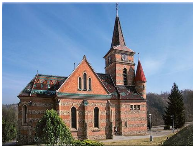
Kostel sv. Cyrila a Metoděje Bílovice nad Svitavou

V naší republice největší chrám věrozvěstů stojí v pražském Karlíně, byl budován ve druhé polovině 19. století. Židenicím nejbližší cyrilometodějský kostel se nachází v Bílovicích nad Svitavou, postaven byl v letech 1908–1913. A starokatolíci mají kapli svatých Cyrila a Metoděje v Brně-Bohunicích.