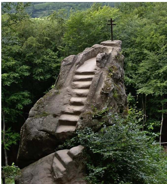
Klimentek – hora sv. Klimenta

Slované teď čtou moudré knihy a dokořán tak bránu rozumu otevřeli.