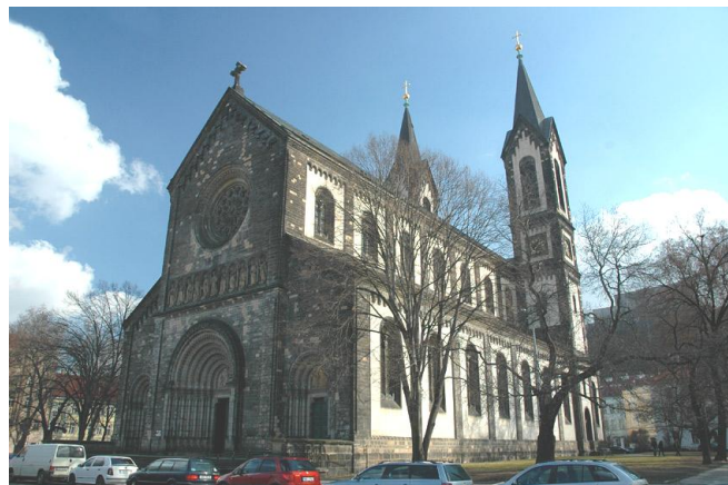
Chrám sv. Cyrila a Metoděje Praha - Karlín

Odjinud mohl. A uvést ve zprávách o počasí. že přes naše území postupuje od východu studená fronta , bylo stejně nebezpečné jako v přehledu o teplotě vzduchu v Evropě oznámit v rozhlase Moskva minus jeden , když zemřel Leonid Iljič Brežněv.