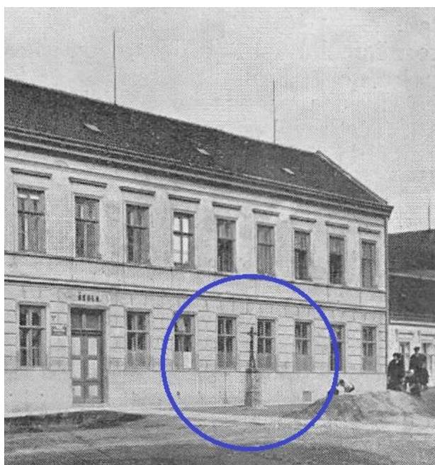
Původní umístění kříže dle www.encyklopedie.brna.cz