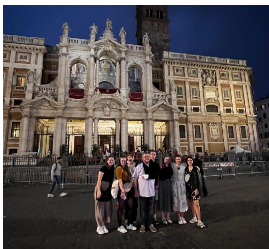
Poutníci před basilikou Panny Marie Sněžné (Santa Maria Maggiore)

Avšak právě před branami Vatikánu se odehrála nečekaná událost. Cestou za tou nejdůležitější, čtvrtou Svatou bránou, se náš milovaný a vážený pan farář dostal do nepříjemnosti, která ho nuceně vyřadila z programu. Ačkoliv jsme kvůli tomu bránu u svatého Petra nestihli projít, vůbec nás to nemrzelo. Pocit úlevy a vděčnosti za to, že je náš pan farář opět s námi a nic horšího se mu nestalo, daleko předčil jakékoli zklamání z neúplného splnění poutního cíle. Zdraví a bezpečí jsou přece nade vše!