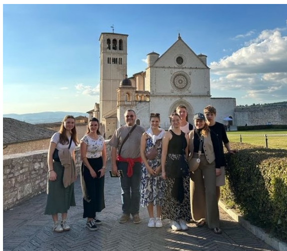
Poutníci a bazilika svatého Františka z Assisi

Naše pouť do duchovního srdce Itálie začala v poklidném a nádherném Assisi. Zde jsme se ponořili do života a odkazu dvou velkých světců, sv. Františka a sv. Kláry. Procházeli jsme františkánské a klariské památky, nasávali atmosféru místa, kde se zrodila františkánská spiritualita. Měli jsme dokonce možnost slavit mši svatou venku u našeho ubytování, a poté v bazilice sv. Marie Andělské. Navštívili jsme místa, která